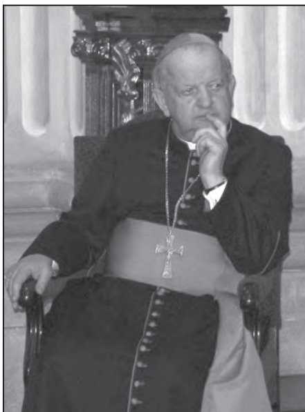
Wielki Kanclerz Uniwersytetu JE ks. kard. dr Stanisław Dziwisz