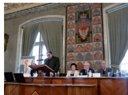
Konferencja o FAS