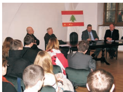
Wizyta Ambasadora Libanu