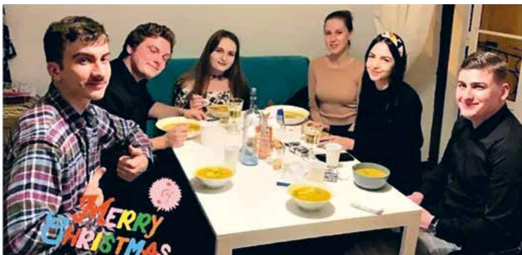
AN UNFORGETTABLE EXPERIENCE! ERASMUS IN PORTUGAL WINTER SEASON A.Y. 2019/2020

Podsumowując, polecam wszystkim taki wyjazd. Zdobywajcie doświadczenia i spełniajcie marzenia :) ■