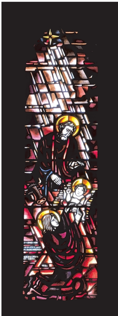
Il. 1. Bernhard Latazki (proj.), Foerster & Krause, współprac. Ostedutsche Werkstätten (wyk.), Narodzenie Chrystusa , 1932, witraż w kościele pw. św. Zygmunta i św. Jadwigi Śląskiej w Kędzierzynie-Koźlu