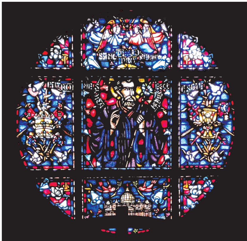
Il. 2. Bernhard Latazki (proj.), Gebr. Held (wyk.), Święty Józef , 1937, witraż w kościele pw. św. Józefa w Raciborzu-Ocicach