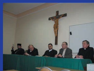
Chrześcijanie o przemocy