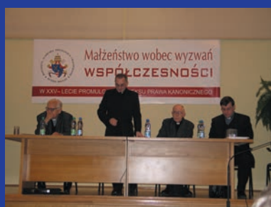
IPK o małżeństwie