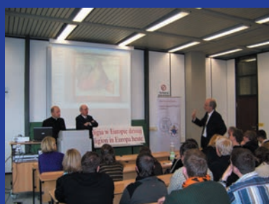
Wizyta w Bochum