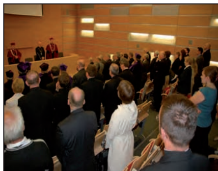
I rocznica UPJPII