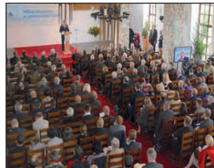
X Konferencja Europejska