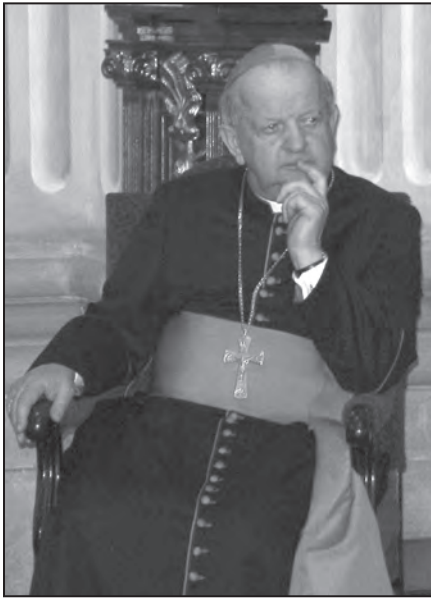
Wielki Kanclerz Uniwersytetu JE ks. kard. dr Stanisław Dziwisz