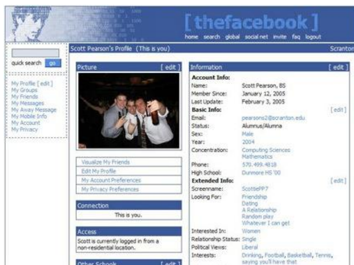
Rysunek 4. Zrzut ekranu serwisu społecznościowego Facebook z 2006 r.