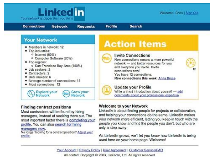
Rysunek 3. Zrzut ekranu serwisu społecznościowego LinkedIn