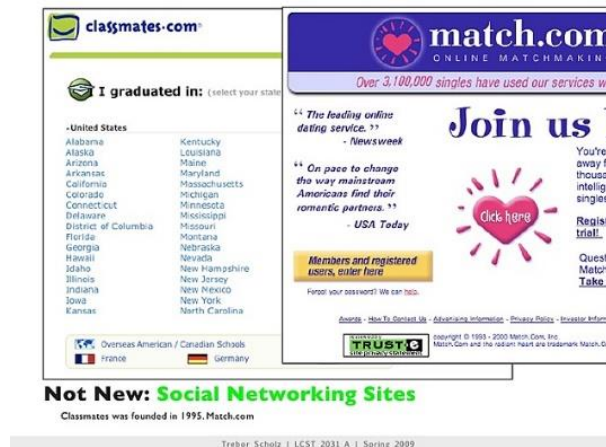
Rysunek 1. Zrzut ekranu pierwszego serwisu społecznościowego Classmate.com