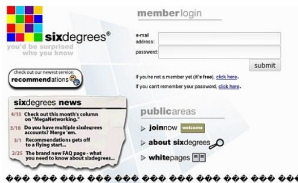
Rysunek 2. Zrzut ekranu serwisu społecznościowego SixDegrees.com