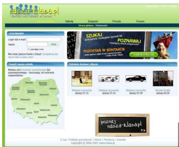
Rysunek 9. Zrzut ekranu serwisu społecznościowego Nasza Klasa w 2007 r.