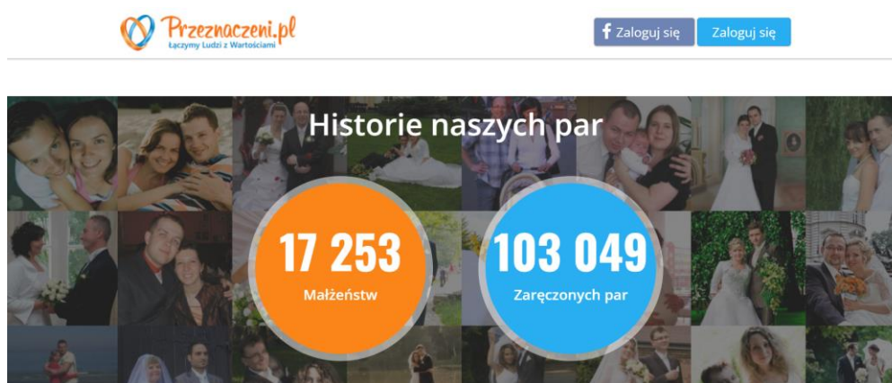
Rysunek 8. Zrzut ekranu serwisu społecznościowego Przeznaczeni.pl

W 2005 roku powstał działający do dziś serwis randkowy Przeznaczeni.pl, skierowany do młodych katolików. Użytkownicy powyżej 18. roku życia mogą zakładać profile, wpisując informacje dotyczące wiary, światopoglądu, wyglądu, zainteresowań czy pracy oraz dodawać zdjęcia i filmy. Serwis oferuje forum dyskusyjne oraz wyszukiwarkę partnerów z możliwością ustalenia kryteriów, takich jak płeć, wiek, poglądy na rodzicielstwo czy wyznawane wartości. Przeznaczeni.pl informuje, że skojarzył ponad 17 tys. małżeństw 50 .