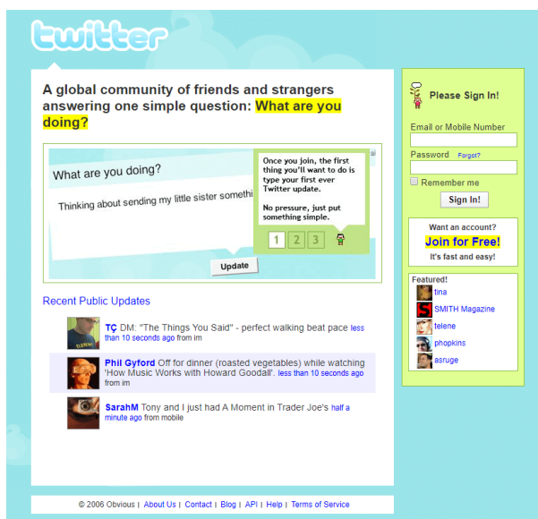
Rysunek 5. Zrzut ekranu serwisu społecznościowego Twitter w 2006 r.