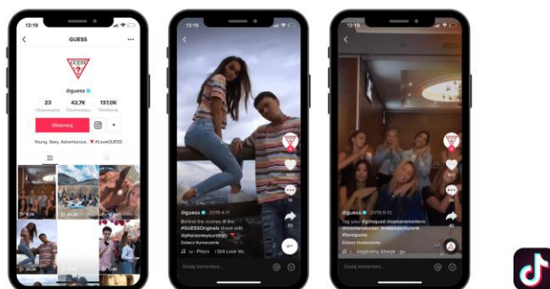
Rysunek 6. Zrzuty ekranu profilu i postów @guess w aplikacji TikTok