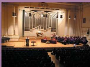
Inauguracja roku 2007/2008